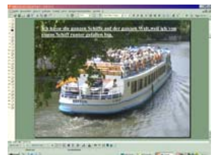
Powerpoint - Screenshots