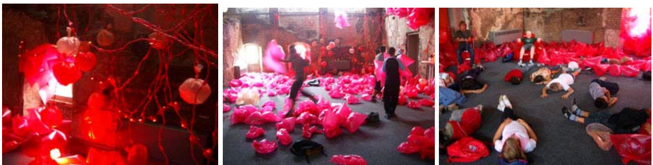
in der Hörsaalruine der Charité, die Installation Red Dye No.2

Die Kinder stürmen den Raum sofort als riesengroße Spielwiese, lassen sich auf die Objekte fallen. Irgendwie verständlich – es erinnert an die Ikea-Spielkiste mit den bunten Bällen... Sie müssen sich hinsetzen – hat schon jemand Erfahrung mit Kunst? H. war vor kurzem mit seinen Eltern in der MoMa-Ausstellung. Er erzählt von den Wärtern, von der Stille, alle standen ehrfürchtig vor den Bildern. Ich schildere andere Kunstformen – Installationen... Dann die Frage: „Sind Sie denn Künstlerin?“