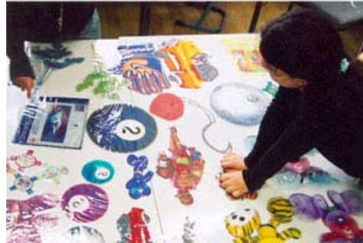
Tisch mit den laminierten Objekten

Mittlerweile bin ich von dem ewigen hin und her ziemlich entnervt, fühle mich mit den Problemen allein gelassen. Später erfahre ich, dass die Vorbehalte gegenüber dem Kubim-Projekt schon eine längere Geschichte haben. Anscheinend bin ich zwischen Fronten geraten, niemand scheint sich mehr wirklich verantwortlich zu fühlen.