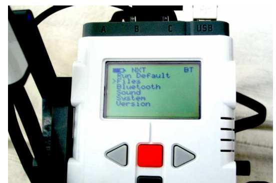
Abb. 2 Menü Files zum Aufrufen übertragener Programme.